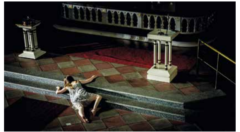
Diakoniatyö auttaa hengellisessä etsinnässä uupuneita.

Joulunaika on diakoniatyössä kiireinen. Perinteiset lapsiperheiden jouluavustukset jaetaan hyvissä ajoin ennen joulua, jotta perheille jää aikaa tehdä avustuksen turvin itselleen tärkeät hankinnat ennen aattoa. Diakoniatyössä avustamme paitsi budjettivaroin myös monenlaisten lahjoitusten turvin. Lapsiperheiden jouluavustusten ohessa jaettavaksi voi lahjoittaa esimerkiksi uusia ja käyttämättömiä leluja, pieniä lahjakortteja, elokuvalippuja tms. Toivomme, että lahjoituksia ei pakotoida. Lahjoituksia vastaanotetaan diakoniatoimistossa ja seurakuntatoimistossa 10.12. asti. Myöhemmin saapuneet lahjoitukset eivät välttämättä enää ehdi tämän joulun iloksi perheisiin. Yhteisvoimin seurakuntana voimme toteuttaa kirkkolain ja -järjestyksen henkeä huolehtimalla, että kristillinen lähimmäisenrakkaus tuntuu