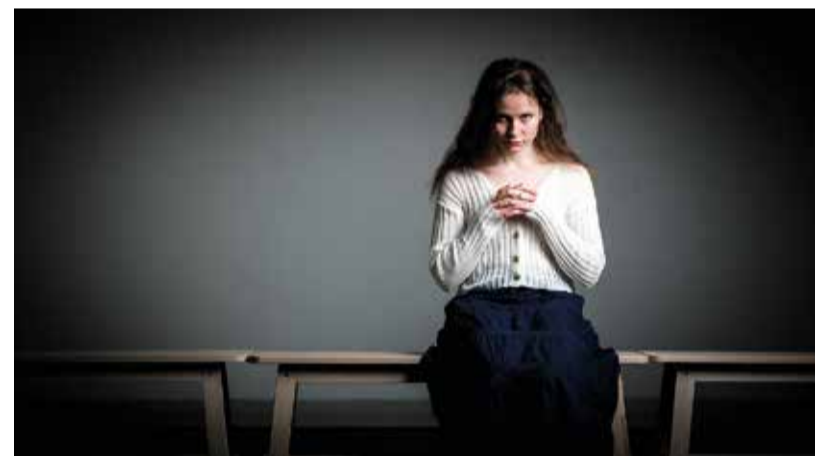
Diakoniatyö auttaa taloudelliseen ahdinkoon joutuneita.