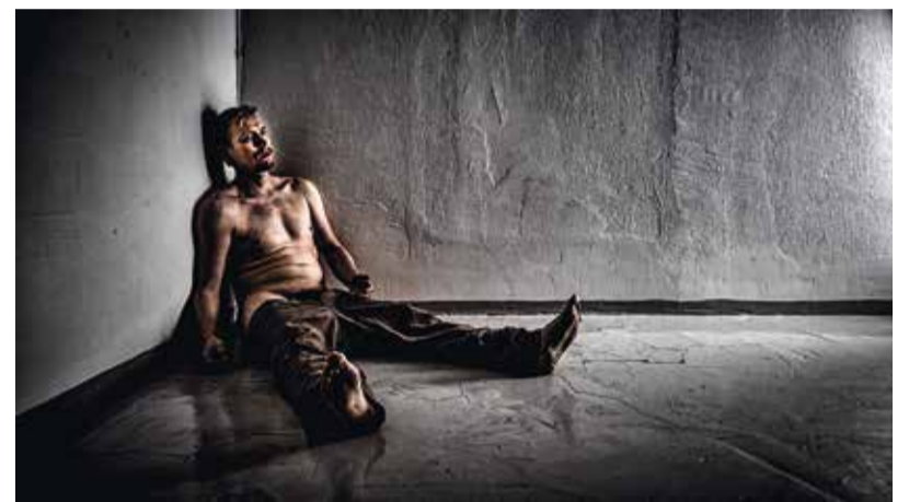
Diakoniatyö auttaa elämässään umpikujaan ajautuneita.