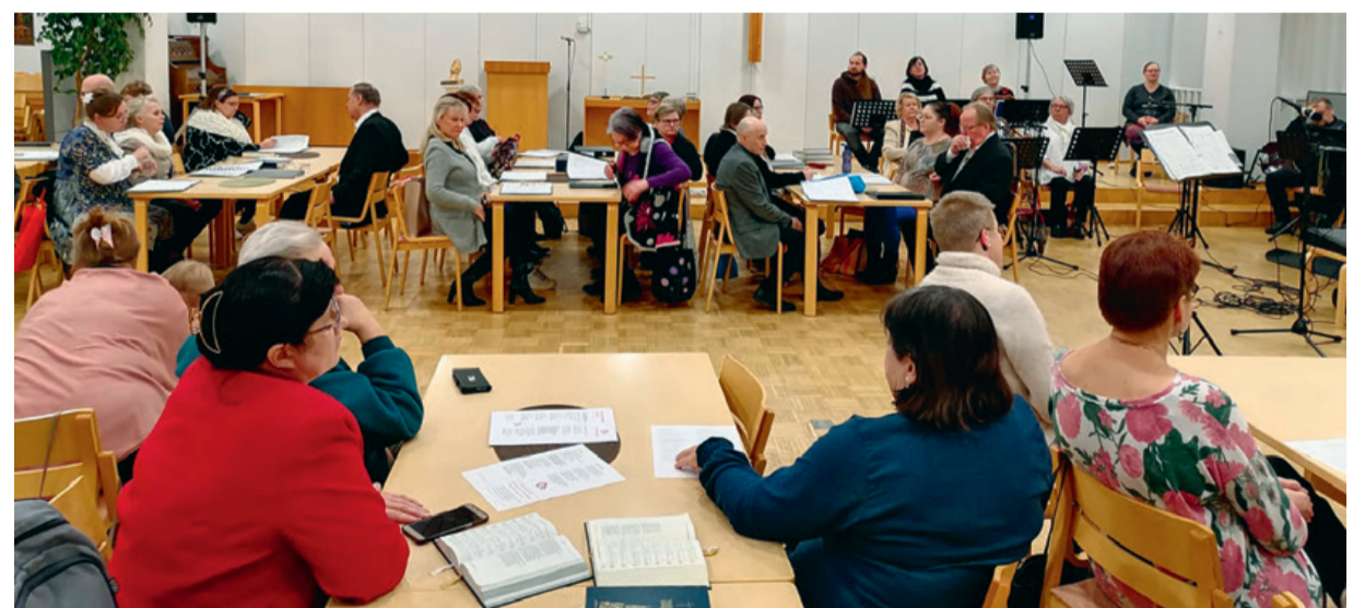
Forssan seurakunnassa kevään Yhteisvastuukeräystä aloitettiin musiikin parissa 24.1.