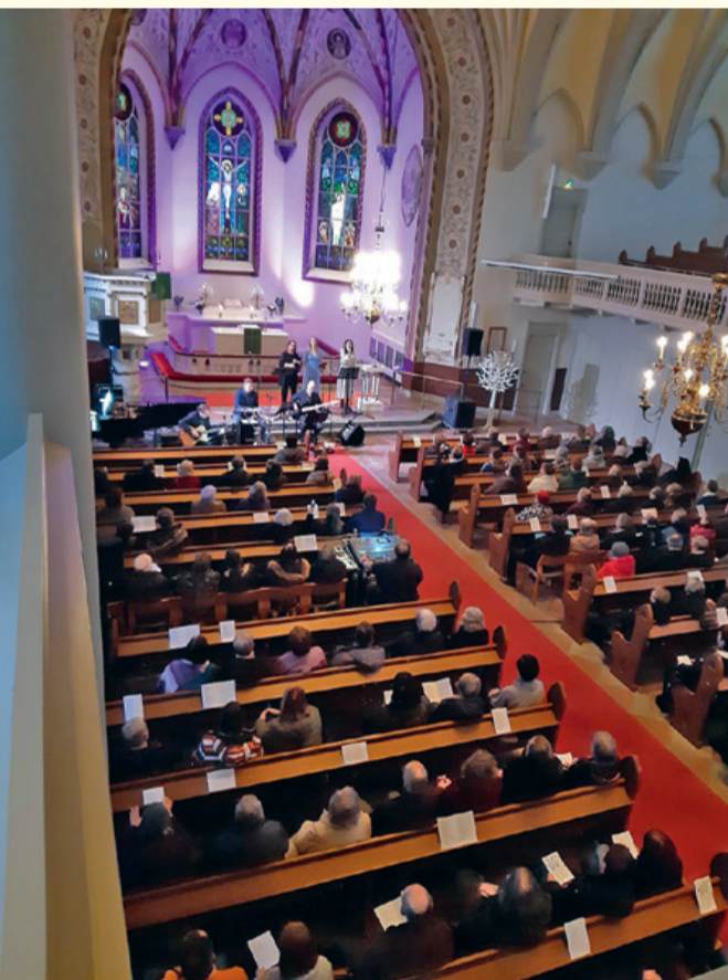
Gospelia taivaan täydeltä kuultiin Forssan kirkossa 28.1.