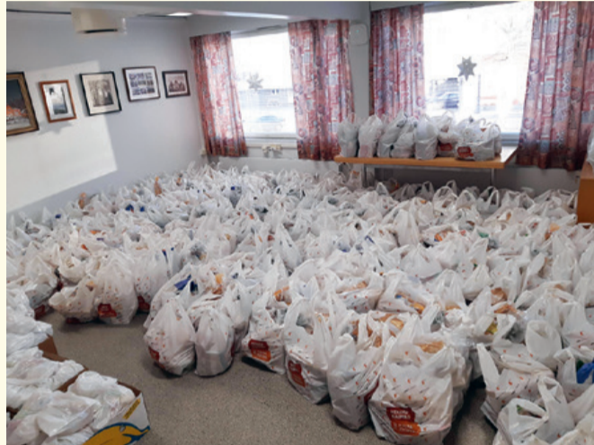
Yksinäisten ja vähävaraisten jouluateriaa oli seurakuntatalo täynnä ruokailijoita ja ruokakasseja jaettiin.