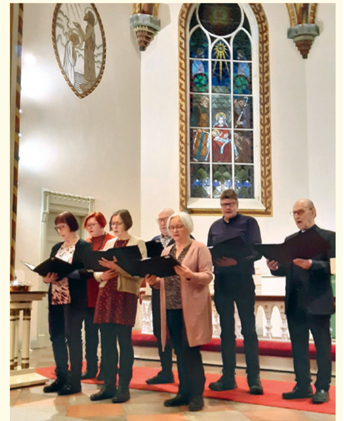
Kristittyjen yhteistä iltakirkkoa vietettiin 21.1. eku-meenisella rukousviikolla.