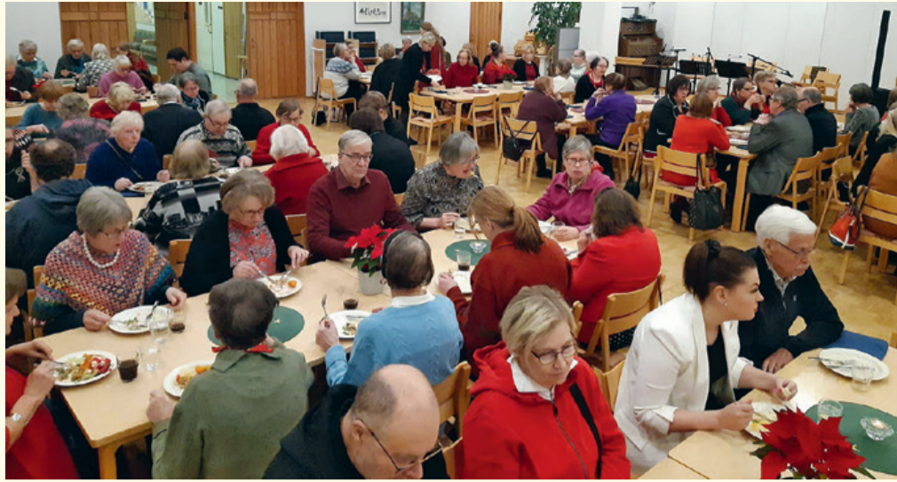
Vapaaehtoisten joulujuhlissa oli monipuolista ohjelmaa, yhdessäoloa ja hyvää ruokaa.