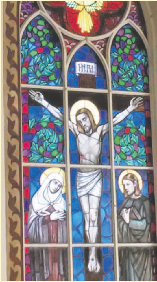
Forssan kirkon lasimaalauksessa Pyhä äiti Maria itkee kärsivän Kristuksen ristin juurella.