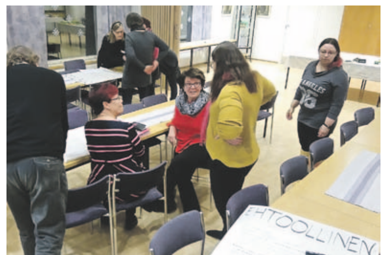
Kuva on napattu Messupysäkin valmisteluporukan valmistelupohdintoista Jokioisten srk-talossa.