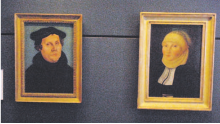
Luther ja vaimonsa Katharina von Bora.

M uistan parinkymmenen vuoden takaisen syntymäpäiväkäynnin Forssassa. Olin onnittelemasta muistisairasta ikäihmistä. Esittäydin seurakunnan pastoriiksi ja onnittelin häntä. Syntymäpäivän kunniaksi lauloimme yhdessä virren. Hän lauloi virren täydellisesti ulkomuistista. Virren jälkeen hän kysyi minulta: ”kukas te olette?” Esittelin itseni uudelleen ja lauloimme toisen virren, jonka hän lauloi edelleen virheettömästi ulkomuistista. Ja taas virren jälkeen sain kertoa kuka minä olen. Tapaus kertoi musiikin valtavasta voimasta: lapsena opitut virret painuvat syvälle muistiin ja säilyvät siellä silloinkin, kun muut asiat ovat muistista pyyhkiytyneet. Sitä suurempi sääli on, ettei virsien opettelu ole nykyään itsestään selvää.