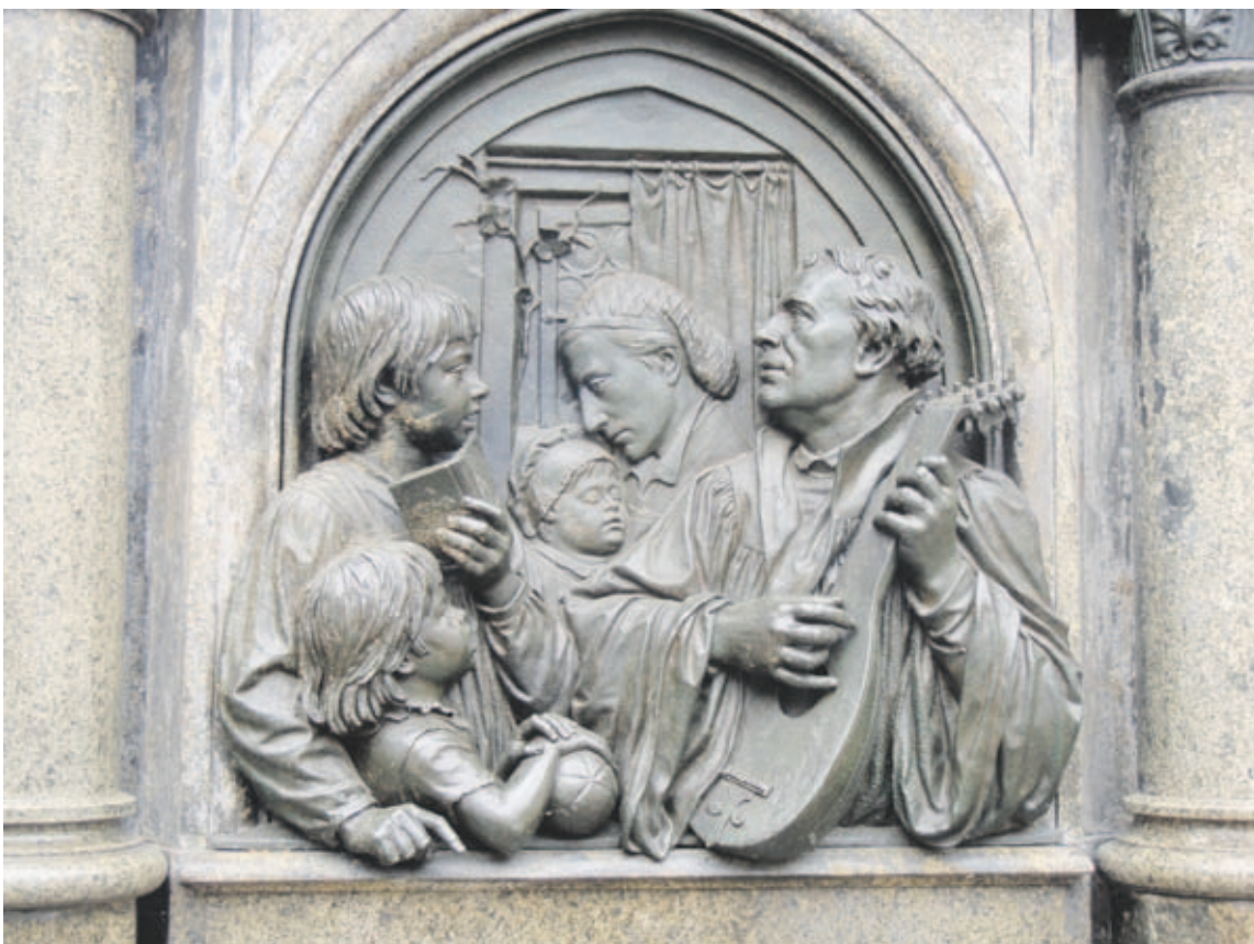
Luther tunnettiin musiikin ystävänä.