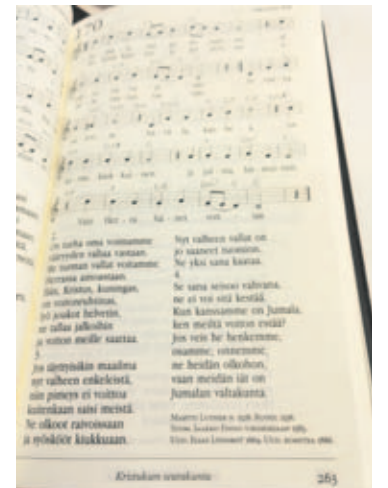
Lutherin tunnetuin virsi on virsikirjassamme 170.

Musiikin herättämä mielihyvä on joskus vaivannut kristittyjä. Kirkkoisä Augustinus