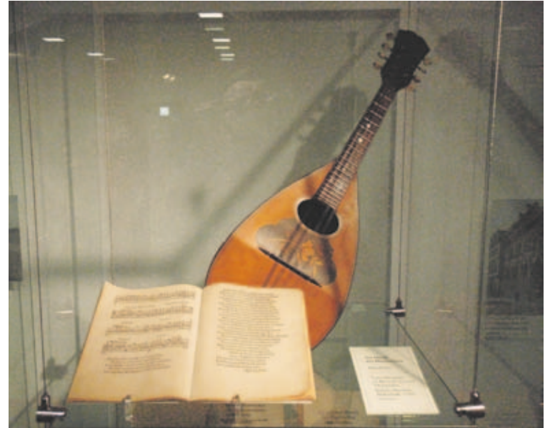
Lutherin aikainen mandoliini. Luther itse soitti luuttua.

Uskonpuhdistuksen aikana musiikin merkitys nousi jälleen tapetille. Lutherin virret olivat hänen tuotantonsa suurimpia hittejä. Niitä laulettiin Espanjassa asti, niin että paikalliset kirkonmiehet pelkäsivät koko Euroopan kääntyvän luterilaisuuteen. Pelko oli ennenaikainen ja aiheeton, mutta kertoo musiikin suuresta voimasta.