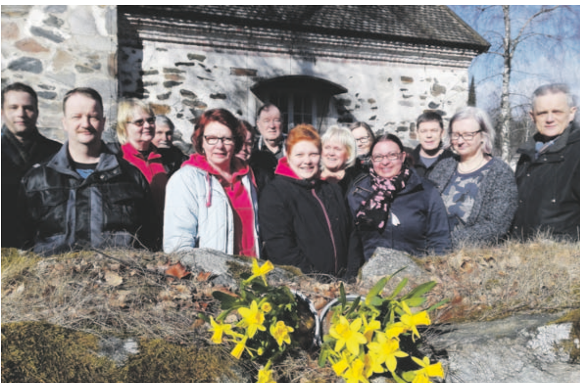
Tammelan seurakunnan työntekijöitä.

Tervetuloa Tammelan seurakunnan pääsiäisen ajan tapahtumiin. Olemme valmistelleet juhlaa ja toivotamme jokaisen seurakuntalaisen lämpimästi tervetulleksi tapahtumiimme.