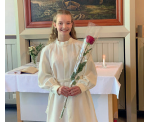
Vaellus päättyi Herran siunaukseen ja onnentoivotuksiin.

Kuluneen kesän koronatilanteen takia perinteisen konfirmaatiomessun osat taipuivat vaellukseksi, jonka konfirmoitava nuori sai kulkea yhdessä omien läheistensä kanssa. Vaellus kuljetti juhla- väen perinteisen konfirmation osien läpi: konfirmaation ja rukouksen halki ehtoolliselle. Vaikka olosuhteet olivat uudet, tunnelma kesäisissä konfirmaatioissa oli iloinen, koskettava ja juhlava.