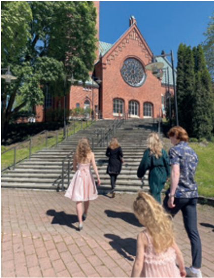
Konfirmaatio alkoi pappilan edestä tervetulo- ja synnintunnustusrastilta, josta lähdettiin portaita pitkin seuraavalle rastille.