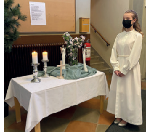
Kirkon eteisessä hiljennettiin rukoukseen.